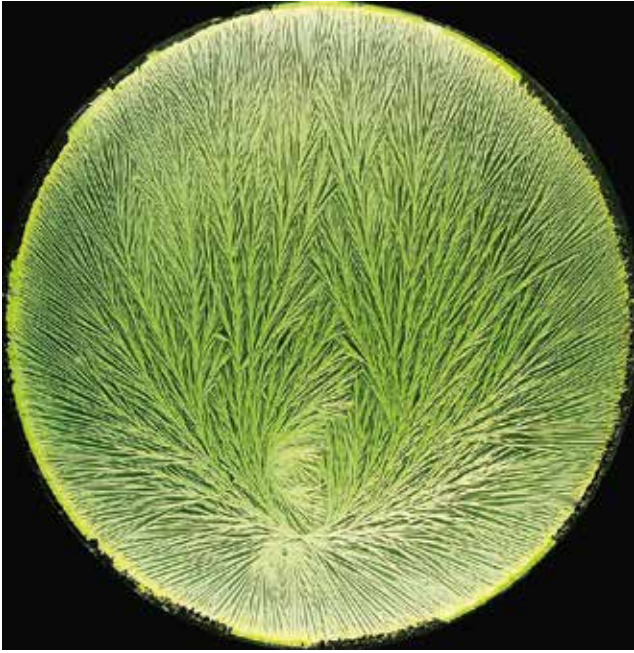
Kristallisatie rauwe melk