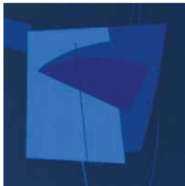
Cécile van Spronsen

Amsterdam, zondagochtend 3 april 2011. Het belooft een stralende dag te worden. Vier dagen eerder viel precies de honderdvijftigste verjaardag van Rudolf Steiner. In binnen- en buitenland gevierd met allerlei festiviteiten. De Rudolf Steiner Vertalingen doet ook een duit in het zakje.