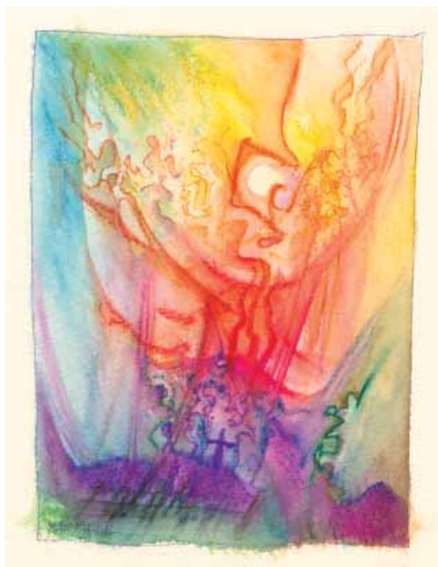
Benno Sloots Ein Deutsches Requiem (Brahms), 10-03-08