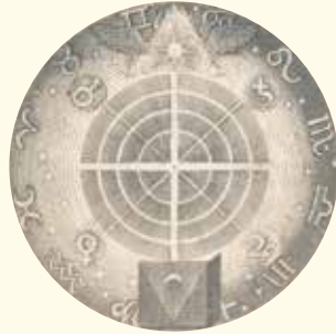
AFBEELDING UIT DE SIGNATURA RERUM, JAKOB BÖHME (DETAIL)

Daarmee heb ik nog niet gezegd welke krachten daarbij in het spel zijn – en daar kan ik ook geen nauwkeurig antwoord op geven. Ik vermoed dat de kracht van hun gedachten er een rol in speelt; Steiner geeft in Wie erlangt man... ( De weg tot inzicht in hogere werelden – red.) aan dat gedachten een reële kracht zijn, en ik sluit daarom niet uit dat onze gedachten fysieke effecten kunnen hebben. Maar ik neem aan dat de wil er ook een rol in speelt: het draait immers rond een wilsimpuls van de persoon die iets ‘wil vinden’, zoals Steiner zelf in het voorbeeld dat u geeft. Dat moet vermoedelijk meer zijn dan een gewone wens: het moet een serieuze wilsimpuls zijn. Hoe het verder werkt, zou ik niet weten.