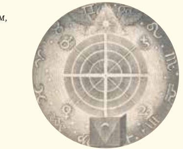
AFBEELDING UIT DE SIGNATURA RERUM, JAKOB BÖHME (DETAIL)

Wat ik er zelf mee doe, is vooral mijn gedachten en gevoelens zoveel mogelijk in overeenstemming